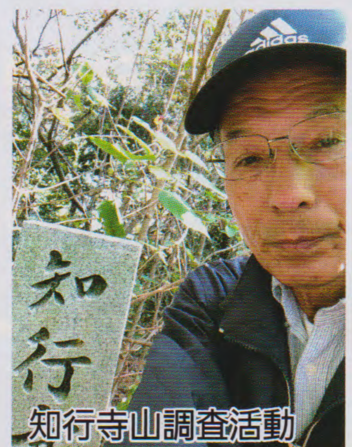
知行寺山調査活動